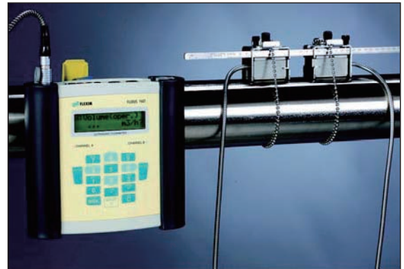
管道固定夹具快速安装